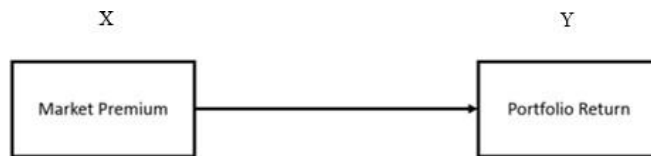
Gambar 1. Kerangka Pemikiran Model CAPM

Model CAPM dan model Fama dan French three factors yang akan diuji pada penelitian ini adalah