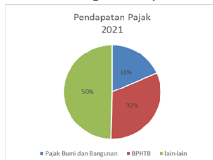
Gambar 4 Pendapatan Pajak 2021

Pada tahun 2021 pajak bumi dan bangunan sebesar Rp 10.062.860.494 atau sebesar 18 % dari total pajak yang diperoleh, sedangkan biaya perolehan hak atas tanah dan bangunan (BPHTB) sebesar Rp 17.373.725.441 atau 32 % dari total pendapatan. Dari kedua grafik tersebut pajak bumi dan bangunan kota sukabumi mengalami kenaikan secara kuantitatif akan tetapi secara proporsional dari