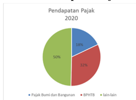
Gambar 3 Pendapatan Pajak 2020

Pada tahun 2020 pajak bumi dan bangunan sebesar Rp 8.969.164.422. atau sebesar 18 % dari total pajak yang diperoleh, sedangkan biaya perolehan hak atas tanah dan bangunan (BPHTB) sebesar Rp 16.092.958.852 atau 32 % dari total pendapatan.