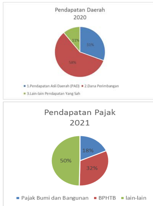
Gambar 2 Pendapatan Daerah 2020,2021

Pendapatan daerah tahun 2020. Rp 657,864,524,231 atau 58 % bersumber dari Dana perimbangan, sedangkan pendapatan asli daerah Rp 343,755,662,641 atau 31% dan Pendapatan lain yang sah Rp 125.260.323.942 atau 11 %. Pendapatan daerah tahun 2021. Rp 703,688,702,118 atau 56 % bersumber dari Dana perimbangan, sedangkan pendapatan asli daerah Rp 344,060,591,430 atau 28 % dan Pendapatan lain yang sah Rp 196.015.130.353 atau 16 %.